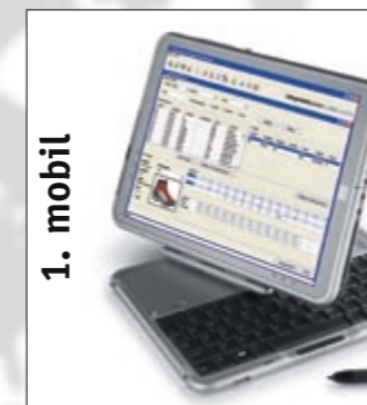
1. mobil Mobile Auftragserfassung

Die wirtschaftliche Komplettlösung für moderne und innovative Handelsunternehmen