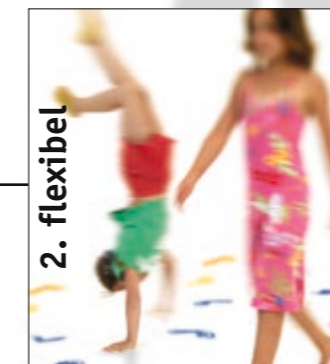
2. flexibel Warenwirtschaftssystem