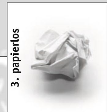
3. papierlos Dokumenten Management